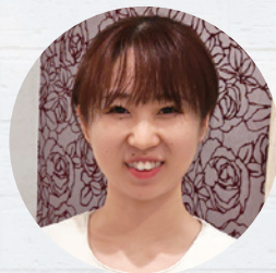
サクラマチ熊本店 おざわ